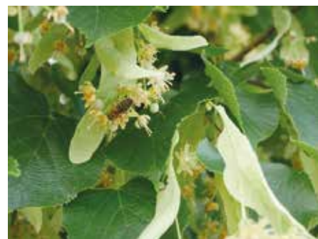
Linde

Jedoch auch einige Gehölze bieten im (Früh)Sommer noch wertvolle Nahrungsquellen für Bienen. Hier sind ganz besonders die heimischen Linden Arten ( Tilia platyphyllos , Tilia