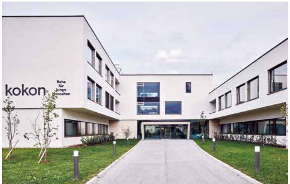
Kinder-Reha aktiv erleben; möglich am 25. April im kokon Rohrbach